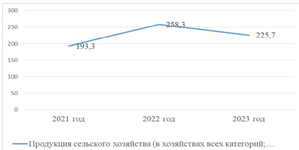
Рисунок 2 – Производство основных сельскохозяйственных культур в хозяйствах всех категорий Республики Башкортостан

В Республике Башкортостан объём производства продукции сельского хозяйства всех сельхозпроизводителей (сельхозорганизации, крестьянские (фермерские) хозяйства, население) за 2023 г. в действующих ценах составил 225,7 млрд руб. (87,3% в сопоставимой оценке к 2022 г.). А именно зерна, подсолнечника, сахарной свеклы, картофеля, овощей в весе после доработки валового сбора, тысяч тонн урожайность, центнеров с одного гектара убранной площади.