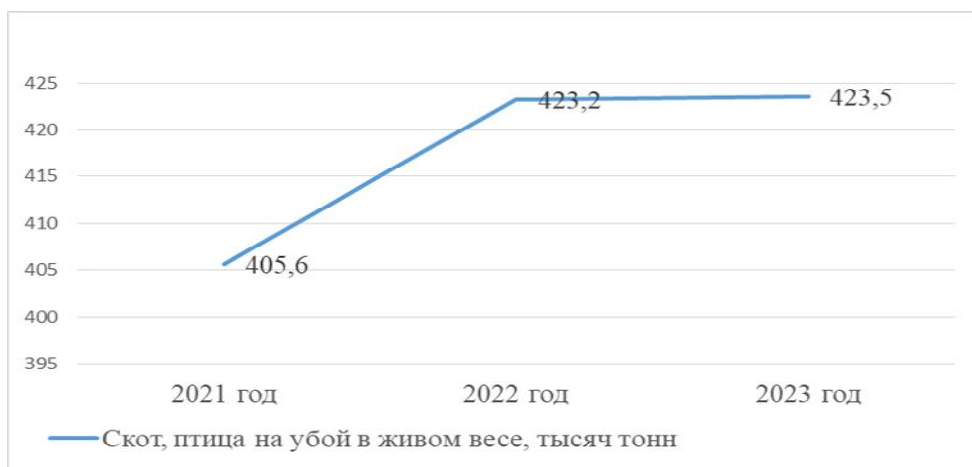
Рисунок 3 – Производство скота, птицы на убой в хозяйствах всех категорий (в живом весе, тысяча тонн) Республики Башкортостан.

По производству скота и птицы на убой в хозяйствах всех категорий (в живом весе, тысяч центнеров) наблюдается такая же тенденция.